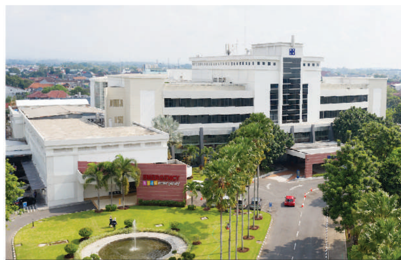
JIH Hospital, Yogyakarta