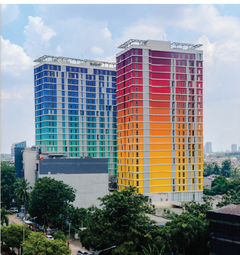
Pejaten Park Apartment, Jakarta